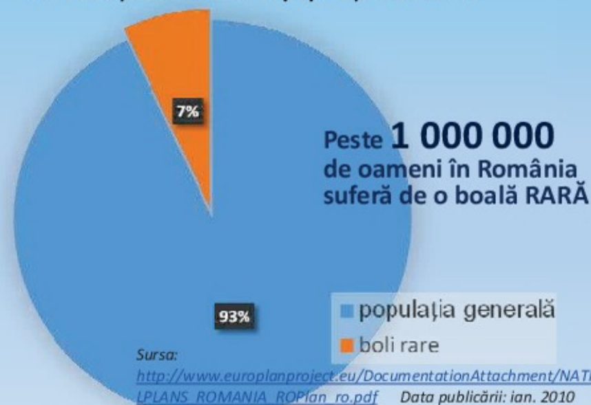
Prevalența bolilor rare în populația României

din copiii cu boli rare nu vor trăi până la vârsta de 5 ani