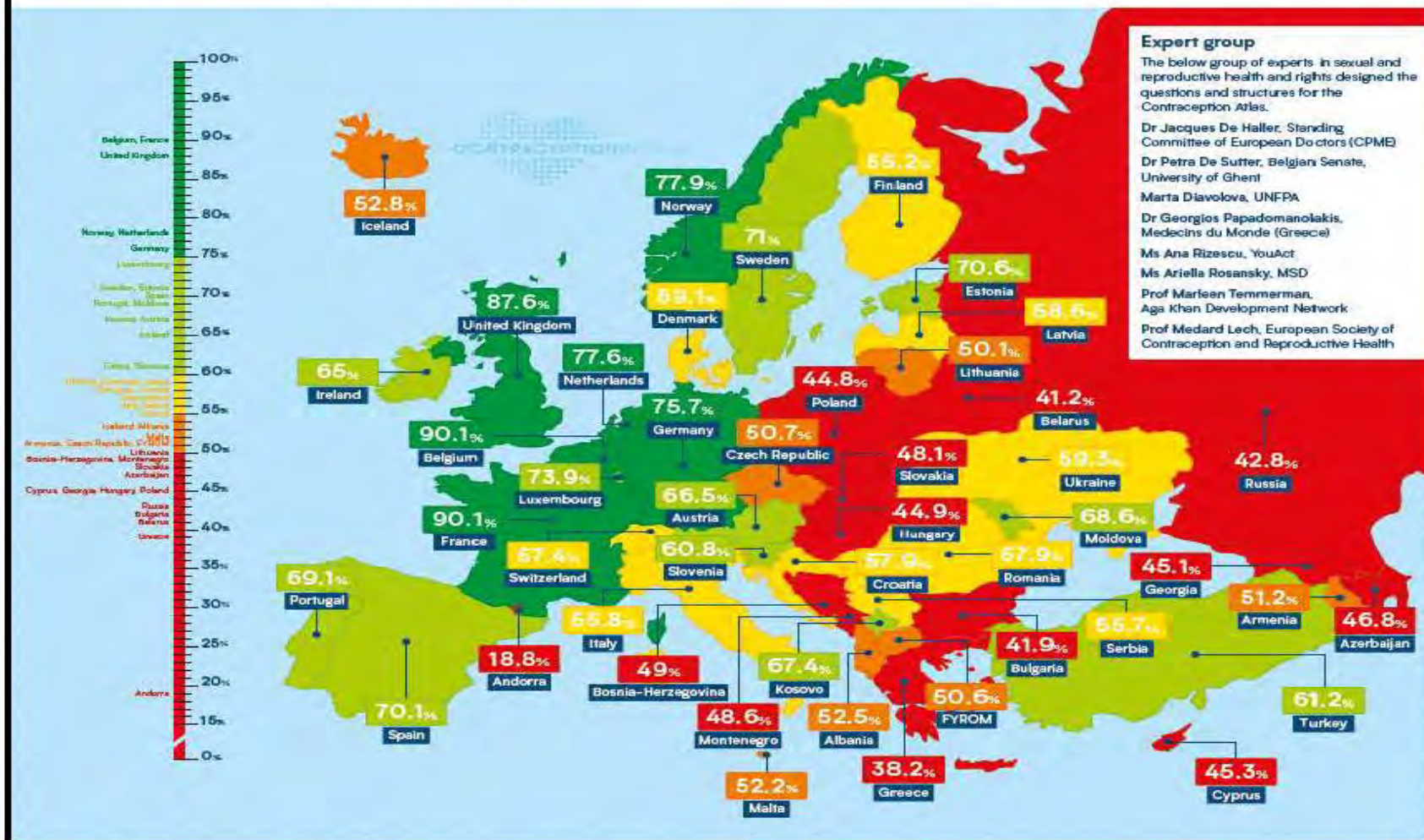
Fig. nr.1. ATLAS-ul mondial cu privire la contraceptie.

For more information, please visit contraceptioninfo.eu