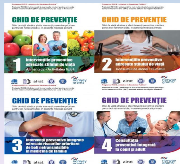
Ghidurile de prevenție elaborate în cadrul proiectului RO19.04 "Intervenții la mai multe niveluri pentru prevenția bolilor netransmisibile (BNT) asociate stilului de viață în România"